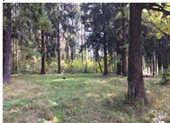
Парк усадьбы «Доброе»

На части территории парка с въездной аллеей находился ныне разрушенный пионерский лагерь «Горьковец», в этих границах сформирован земельный участок, предназначенный для размещения лагеря (территория 1). Другая часть усадебного парка приходится на территорию заброшенного объекта советских времен, при этом находящаяся на земельном участке с видом разрешенного использования под