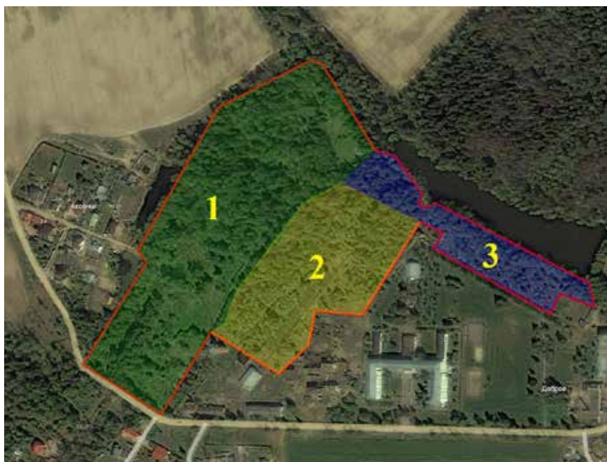
Парк усадьбы «Доброе»