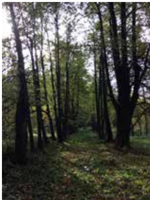
Липовая аллея в парке усадьбы «Алёшино»

школу-интернат вместе с располагающимся рядом домом отдыха (территория 2). За парком расположен большой пруд, со всех сторон окруженный высокими деревьями.