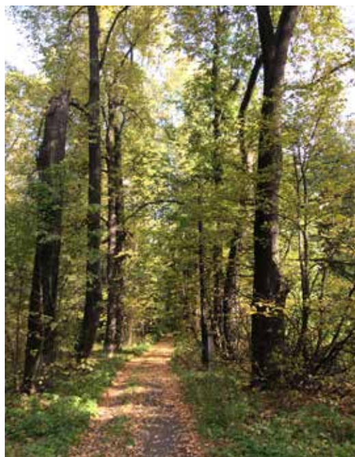
Въездная аллея «Доброе»