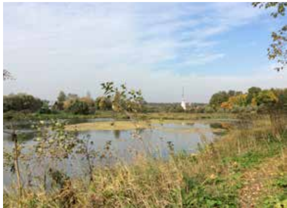
Вид из парка на пруд «Алёшино»

(территория 1), и 5 гектар, отделенных дорогой (территория 2). При этом, если на территории в 11га будет восстановлен парк и воссозданы некоторые постройки усадьбы, то на участке в 5га могут быть расположены объекты инфраструктуры сферы туризма и гостеприимства.