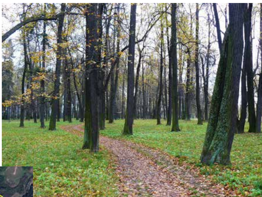
Парк усадьбы «Тишково»

Сегодня большая часть сохранившегося парка расположена на земельном участке, относящемся к категории особо охраняемых земель (территория 1), в юго-восточной его части сегодня расположена база отдыха коттеджного типа. Воссоздание усадебно-