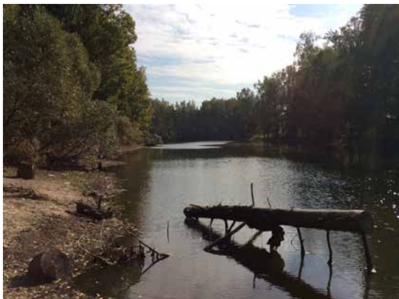
Пруд усадьбы «Доброе»

го комплекса и развитие территории логично комплексно с прилегающим к парку с севера земельным массивом, расположенным на берегу реки Вязь (территория 2), в настоящее время предполагающим дачное строительство. По-нашему мнению, на исторических территориях предпочтительнее выглядит воссоздание усадебной среды, нежели появление очередного коттеджного поселка.