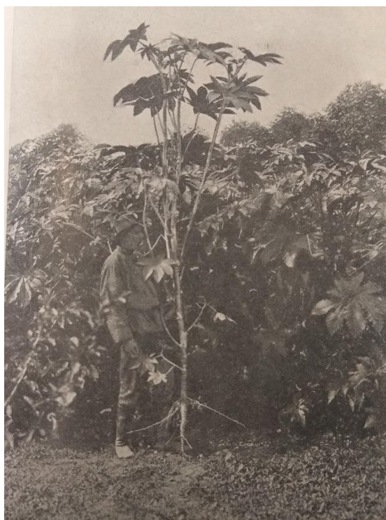
Посев клещевины на территории станции. Фото 1916 г.

условиями и их влиянием на рост и урожай садовых культур. Также здесь проводилось изучение различных природных явлений, негативно влияющих на растения.