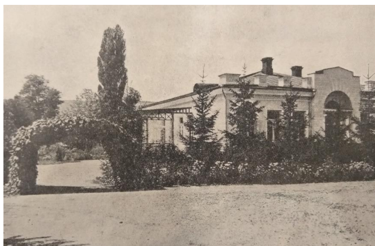
Дом Палласа, в котором размещались заведующий школой и ее преподаватели.

по реставрации здания, а также его приспособление под нужды лаборатории. Были проложены газовые и водопроводные трубы, проведено электричество, установлены вытяжные шкафы. Всего в помещении насчитывалось 6 комнат: общая химическая, лаборантская, весовая, кабинет химика, азотная и