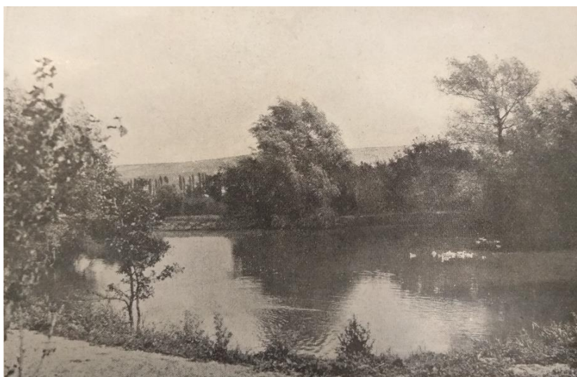
Пруд на территории станции.