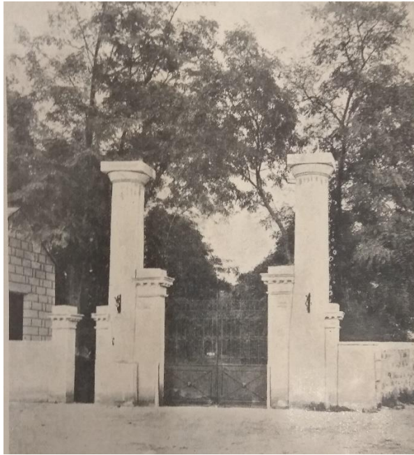
Въезд в Салгирскую опытную помологическую станцию.

В 1907 г. при Таврической губернской земской управе прошел ряд совещаний, посвященных проблеме организации опытной помологической станции, на которых были намечены задачи учреждения, определен личный состав [20, с. 2–3]. По мнению участников совещаний, станция должна была «служить разработке вопросов степного плодоводства юга России» [20, с. 2]. Результатом деятельности собраний стала докладная записка, представленная в Департамент земледелия Государственной Думы. 9 июня 1912 г. последовало высочайшее утверждение, одобренное Государственным советом и Государственной Думой, об учреждении с 1 января 1913 г. опытной плодоводственной станции в казенном имении «Салгирка» [20, с. 3].