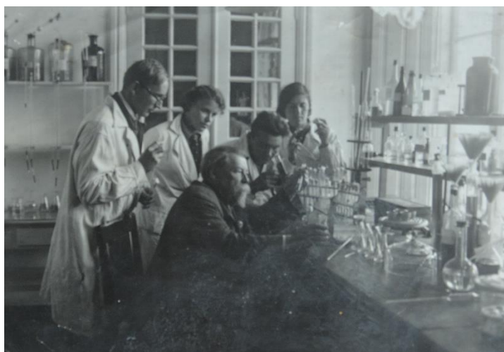
Студенты Крымского сельскохозяйственного института в лабораториях «Салгирки». Фото 30-х гг. XX в.

В 1928 г. Салгирская опытная плодородственная станция была преобразована в Салгирскую садово-огородную областную станцию [21, с. 153–155]. В 1930 г. в ведомство учреждения входили территории не только бывшего имения «Салгирка», а также земли в Кара-Кияте (совр. с. Грушевое Симферопольского р-на) и в ряде крупных совхозов и колхозов в различных районах полуострова. Станция в это время вела активную работу по следующим направлениям: изучение садово-огородных почв Крыма, водного и питательного режима почв; проблемы питомниководства (поиск засухоустойчивых и морозоустойчивых подвоев); биологии плодового дерева; работы по вопросам стандартизации съемки и сортировки, упаковки и хранения; проблемы огородничества [21, с. 153–154]. Если в 1929 г. штат станции состоял из 11 человек, из которых 5 являлись специалистами в различных областях сельского хозяйства, то в 1930 г. количество штатных сотрудников было увеличено до 26