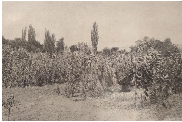
Персиковый сад. Деревья, высаженные в 1915 г.