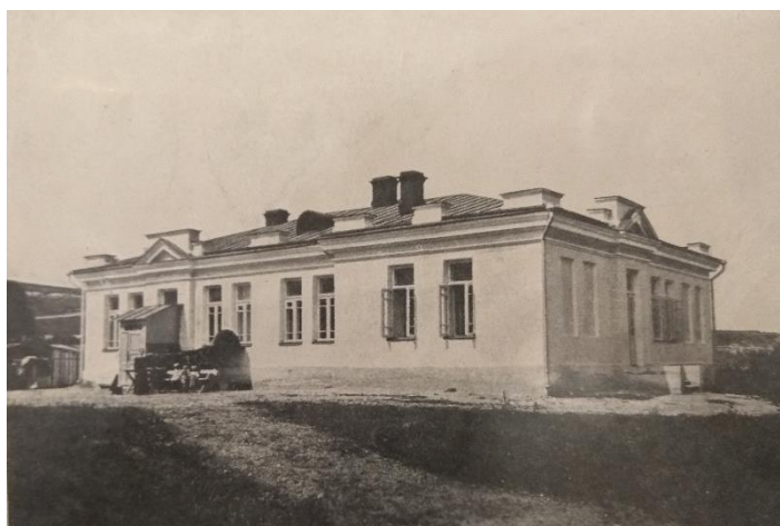
Дом для младших служащих.