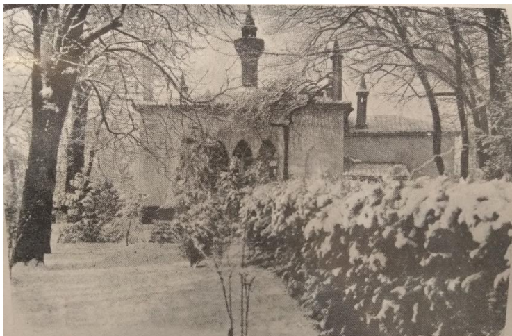
Химическая лаборатория. Фото 1 января 1916 г.

Юрьевский университет по агрономическому отделению физико-математического факультета [11, л. 69]. В феврале 1914 г. Императорский Юрьевский университет присвоил ему степень кандидата сельского хозяйства за диссертацию «Влияние пересадки и окучевания на кущение и укоренение хлебных злаков». С марта 1914 г. он занимал должность