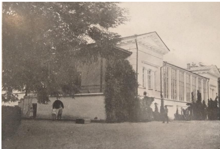
Главный фасад дома Воронцова. Фото 1915 г.

Если отведением земель станция была обязана А. Х. Стевену, то организация работы и разработка программных документов легла на плечи энтомолога С. А. Мокржецкого (1865–1936) [22; 23]. Ученый родился 2 мая 1865 г. в имении Дзитрики Виленской губернии в помещичьей семье. В 1884 г. окончил Виленское реальное училище, а в 1889 г. –