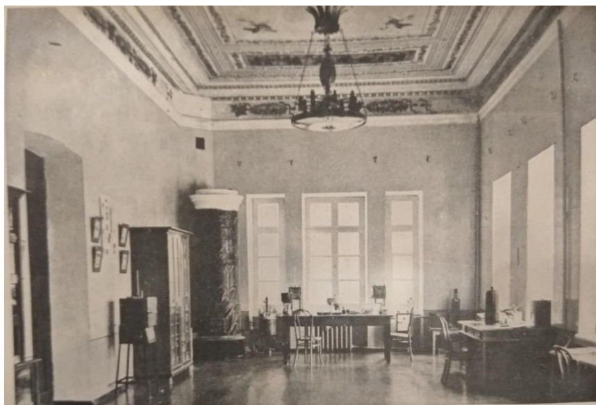
Микологический кабинет в доме Воронцова.

После создания помологической станции в имении «Салгирка» находилось 2 учреждения, между руководством которых постоянно возникали различные конфликты. Основной причиной был недостаток на территории имения удобной для посадки растений земли. В апреле 1914 г. на заседании Симферопольского отдела Императорского русского общества садоводства развернулись ожесточенные дебаты по поводу будущего двух учреждений [24, с. 211–232]. На этом же заседании было принято решение об обеспечении станции необходимым количеством земли, соответствующими средствами и персоналом для осуществления возложенных на нее задач. Все имение «Салгирка» должно поступить в ведение опытной помологической станции [24, с. 215].