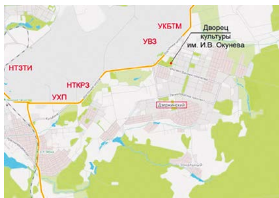
Иллюстрация 3. Схема Дзержинского административного района г. Нижний Тагил с указанием местоположения дворцов культуры и промышленных предприятий. URL: http://ntagil.org (дата обращения: 10.05.2014)