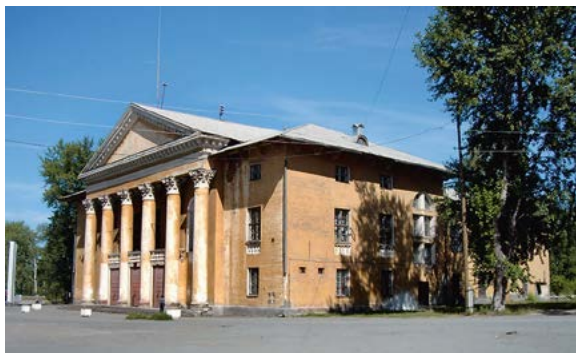
Иллюстрация 7. Дворец культуры Рудника имени III Интернационала. 2012 г.