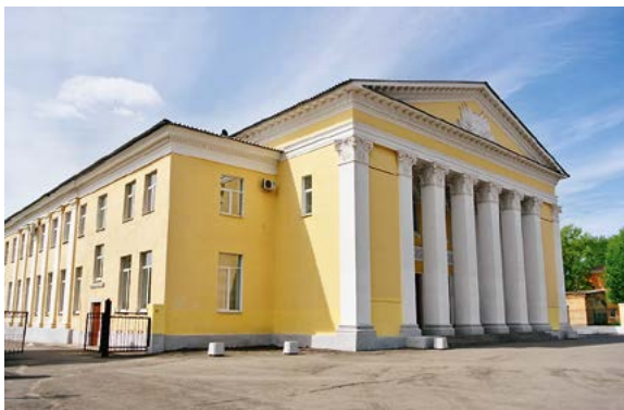
Иллюстрация 6. Дворец культуры имени Ю. А. Гагарина. 2014 г.