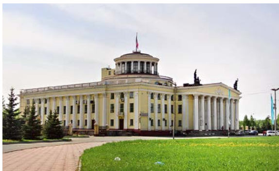
Иллюстрация 4. Дворец культуры НТМК. 1952 г. Арх. В. В. Емельянов. 2014 г.

При проектировании и строительстве данных объектов просматривается комплексный подход: не только наружная архитектура этих зданий отличается монументальностью, активно демонстрирует синтез искусств (скульптуры, архитектуры, монументальной живописи), но благоустройство территории и убранство интерьеров.