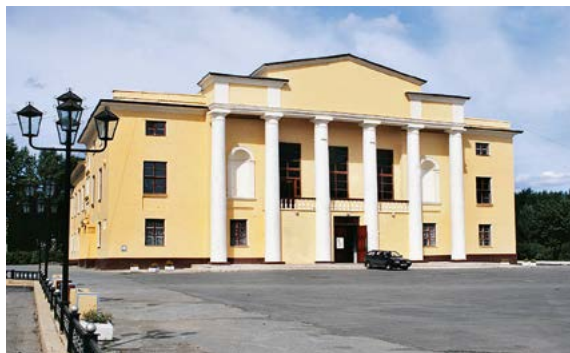
Иллюстрация 8. Дворец культуры огнеупорщиков. 2007 г.

Рассматривая роль и место дворцов культуры в процессе развития стиля неоклассицизм, необходимо отметить,