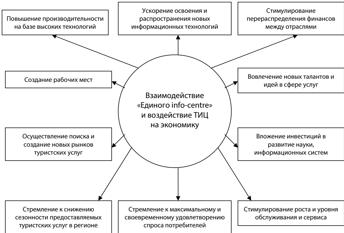
Рис. 2. Структура взаимодействия «Единого ТИЦ» и экономики КБР

предлагая гостям новый уровень комфорта и безопасности. О возможностях и преимуществах ТИЦ, необходимости их создания в регионах с туристско-рекреационной специализацией совершенно справедливо пишут в своих работах И.А. Киселева, А.М. Трамова и О.А. Чернякина [14, с. 150; 15, с. 49].