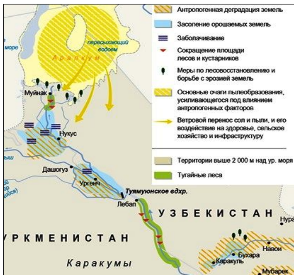
Рис. 1. Экологические проблемы в низовьях реки Амударьи [7]

века в низовьях реки Амударьи насчитывался 61 сорт пойменных растений. Из этих растений туранга, ластовень, лох, гребенщик, ива, чингиль, ломонос, солодка относятся к основной группе тугаев. В кустарниковой части тугаев встречаются чаще всего кермек, лебеда, гребенщик, кермек, карабарак, ажирык, парнолистник, и различные солянки [1, 9].