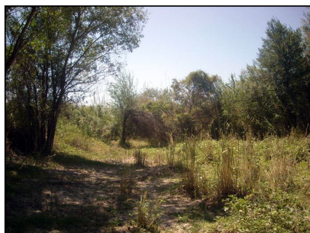
Рис. 2. Тугайный лес Центральной Азии [2]

Тугаи с богатым биоразнообразием протягиваются прерывистой полосой вдоль