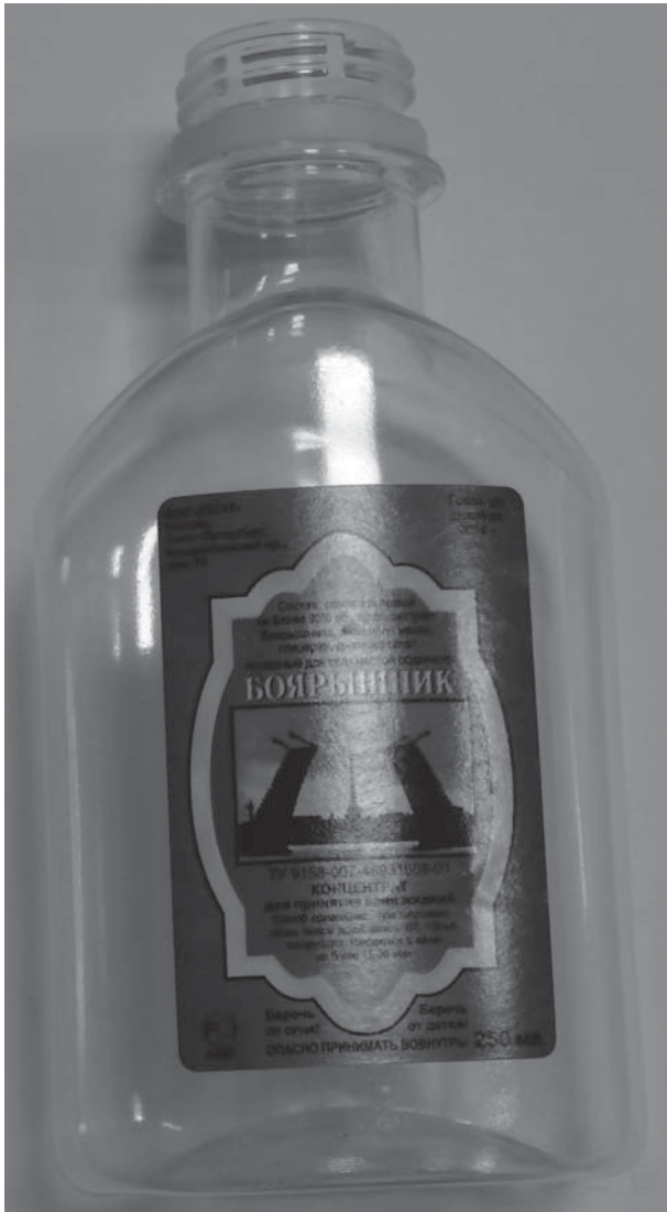
Рис. 1. Флакон из-под спиртосодержащей косметической жидкости «Боярышник» (с желтой пробкой), послужившей причиной массового отравления в Иркутске.