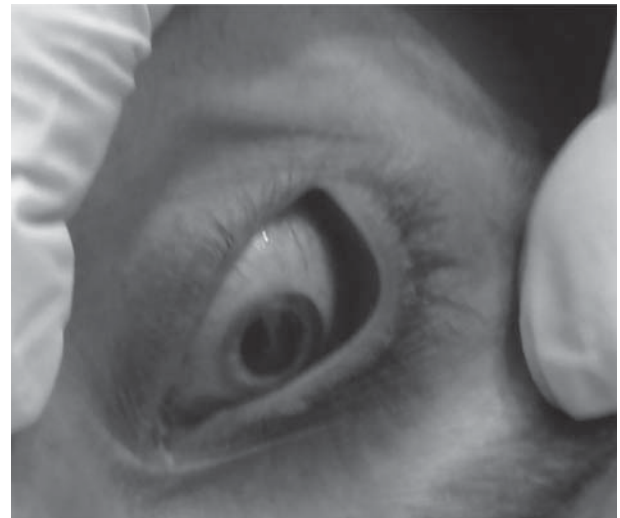
Рис. 3. Резкий ареактивный мидриаз, напряженные глазные яблоки, выраженная инъекция сосудов склер у пациента с острым отравлением спиртосодержащей косметической жидкостью «Боярышник» (метанолом).

Длительность госпитализации составляла от 30 минут до 8 суток. Летальность 55,6%.