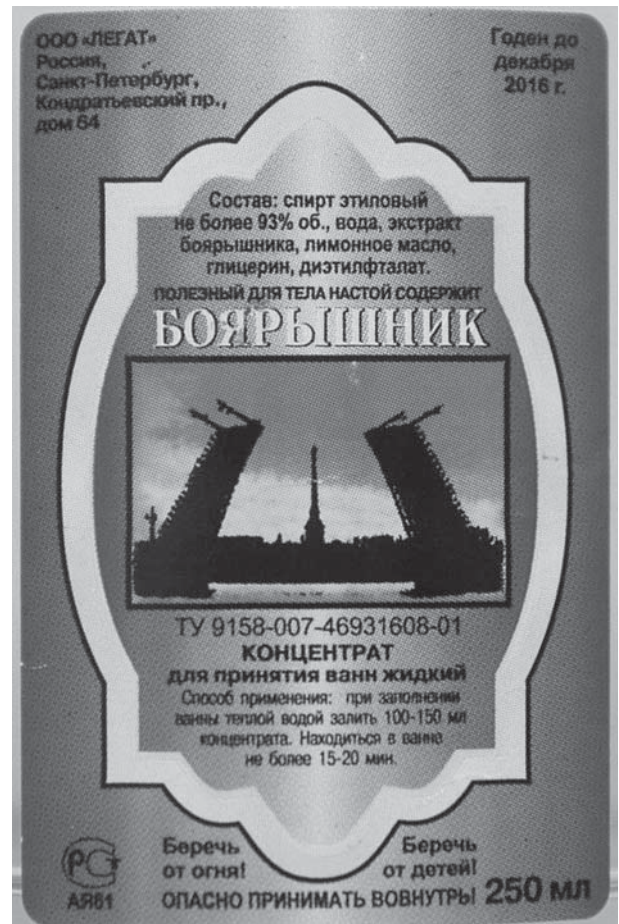
Рис. 2. Этикетка на флаконе с концентратом для принятия ванн жидким «Боярышник».