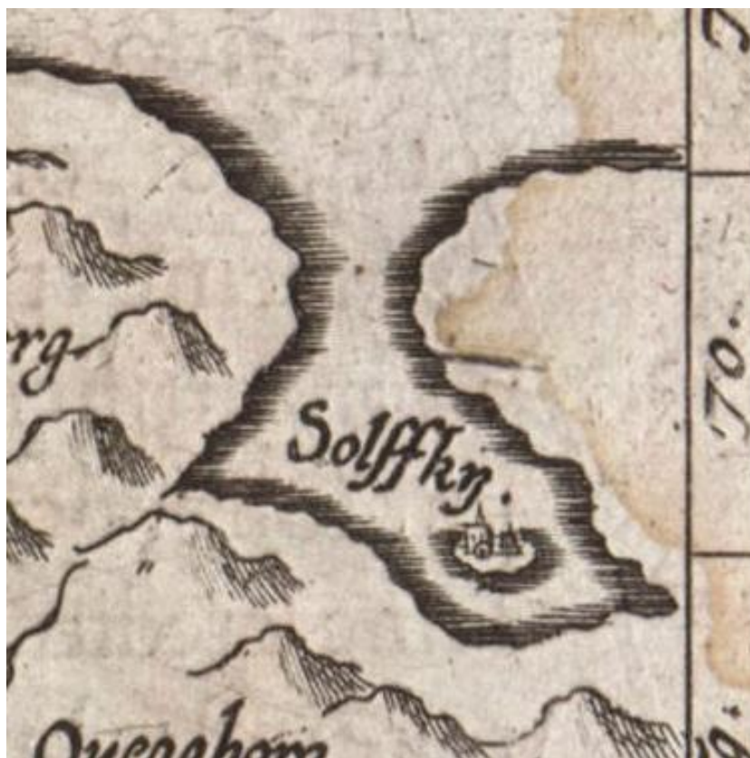
Рис. 3. Соловки на карте Г. де Йоде. 1570 г.

Соловки на картах XVI–XVII в. имеют разные топонимы: «Soloffki», «Solofki» (рис. 4), «Solowka Insvla», «Solofka», «Soloffky», «Solffky», «Soulofki» (рис. 5), «Solafka», «Senloski».