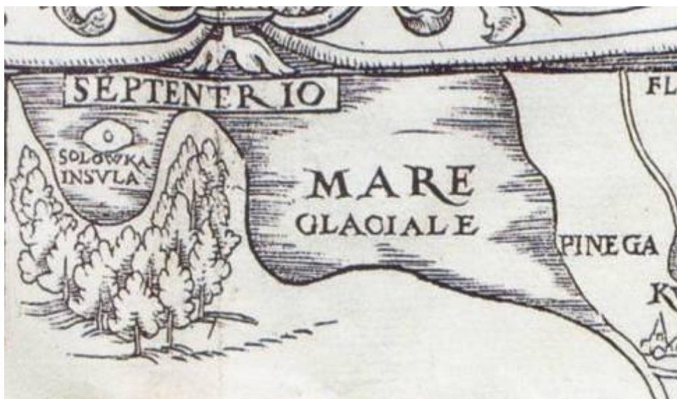
Рис. 2. Соловецкие острова на карте С. Герберштейна. 1546 г.

Большинство картографов XVI–XVII вв. (С. Герберштейн (рис. 2), С. Мюнстер, У. Борро, П. Бертиус, Г. де Йоде (рис. 3), Г. Герритс, В. Блау, И. Тиритон и др.) обозначают в своих трудах Соловки. Из тридцати четырех проанализированных карт Соловецкие острова отмечены на двадцати пяти. Это является свидетельством того, что большая часть мореплавателей и картографов того времени знали о существовании данного географического объекта.