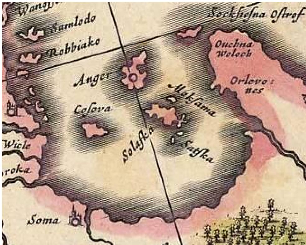
Рис. 8. Остров Заяцкий на карте Я. Блау. 1635 г.

Местоположение Соловков в беломорском бассейне на большинстве карт XVI–XVII в. указано неверно (рис. 9).