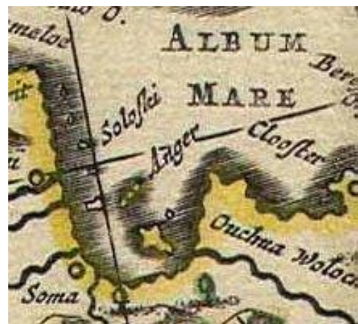
Рис. 7. Остров Анзер на карте Ф. де Вита. 1660 г.