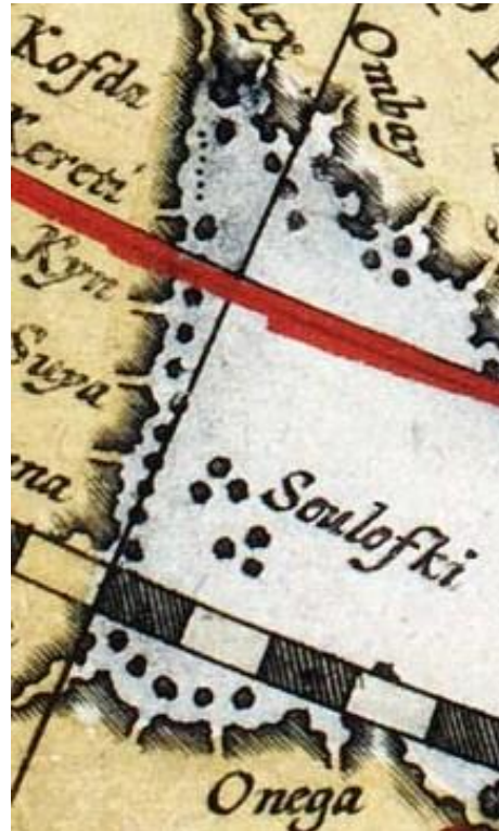
Рис. 5. Соловецкие острова на карте Т. де Бри. 1598 г.

Отдельные острова, входящие в группу Соловецкого архипелага, отмечены лишь на нескольких картах: Анзер («Анга» – 1614 г. Г. Герритс (рис. 6); «Anger» – 1612 г. И. Масса, 1635 г. Я. Блау (рис. 8), 1660 г. Ф. де Вит (рис. 7); Заяцкий («Satska» – 1612 г. И. Масса, 1635 г. Я. Блау (рис. 8); Муксалма («Muksama» – 1635 г. Я. Блау (рис. 8).