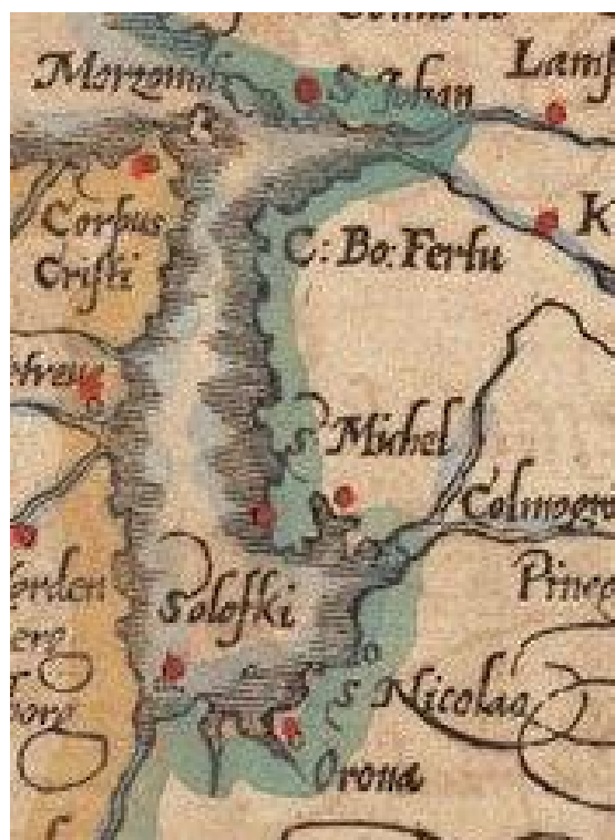
Рис. 4. Соловки на карте С. Мюнстера. 1598 г.

Соловки на картах XVI–XVII в. имеют разные топонимы: «Soloffki», «Solofki» (рис. 4), «Solowka Insvla», «Solofka», «Soloffky», «Solffky», «Soulofki» (рис. 5), «Solafka», «Senloski».