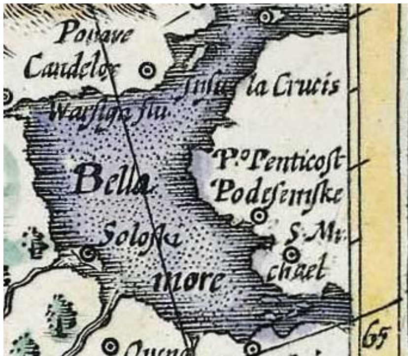
Рис. 9. Соловецкие острова на карте Г. Меркатора. 1607 г.

Местоположение Соловков в беломорском бассейне на большинстве карт XVI–XVII в. указано неверно (рис. 9).