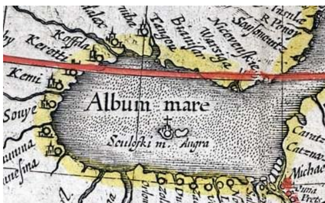
Рис. 6. Остров Анзер на карте Г. Герритса. 1614 г.

Отдельные острова, входящие в группу Соловецкого архипелага, отмечены лишь на нескольких картах: Анзер («Анга» – 1614 г. Г. Герритс (рис. 6); «Anger» – 1612 г. И. Масса, 1635 г. Я. Блау (рис. 8), 1660 г. Ф. де Вит (рис. 7); Заяцкий («Satska» – 1612 г. И. Масса, 1635 г. Я. Блау (рис. 8); Муксалма («Muksama» – 1635 г. Я. Блау (рис. 8).