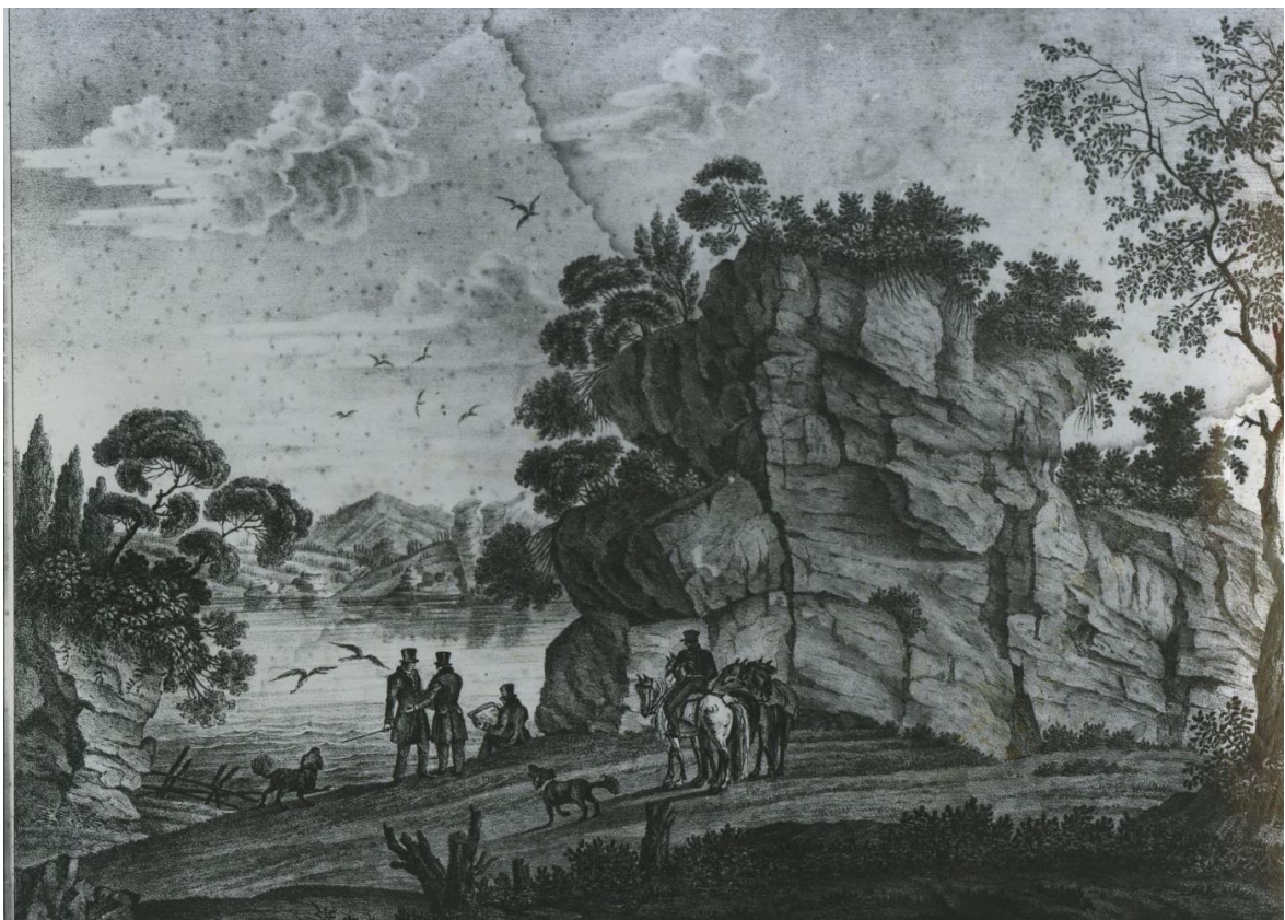
Рис. 8. Кольванское озеро, гравюра неизвестного художника [6]