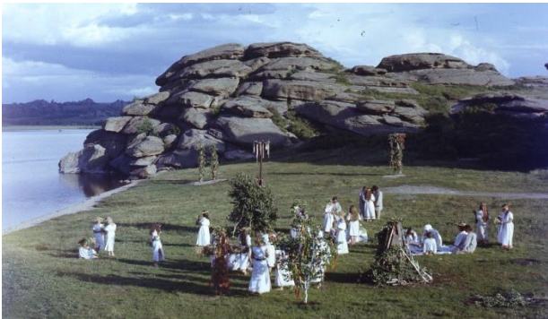
Фото 2. Съемка постановочного фильма