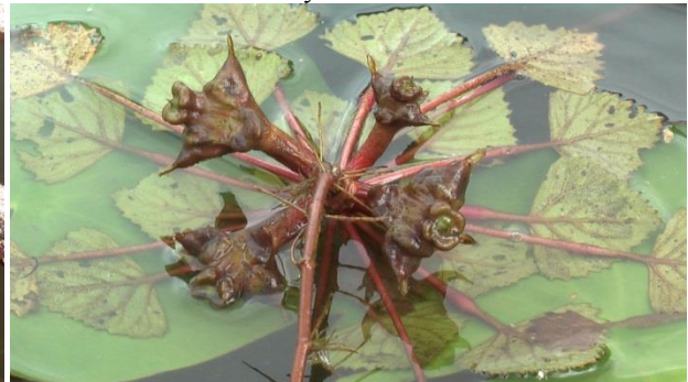
Фото 5. Чилим: незрелые плоды