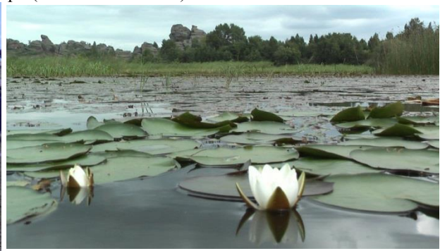
Фото 3. Кувшинка белая