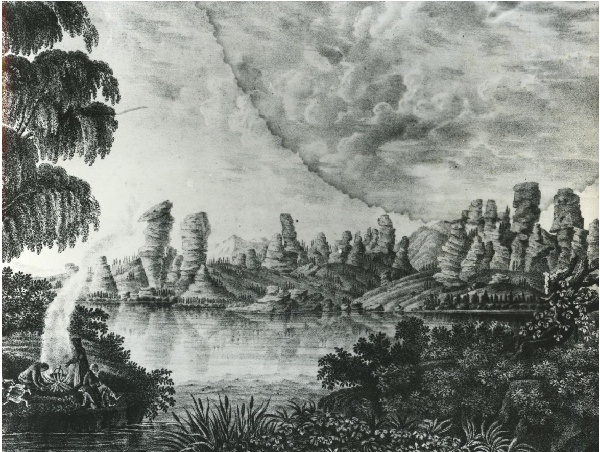
Рис. 7. Кольванское озеро, гравюра неизвестного художника [6]