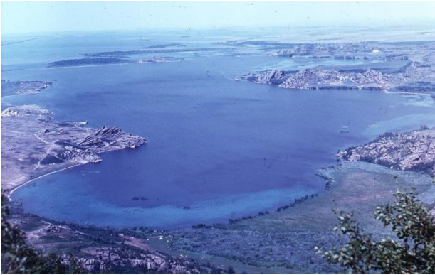
Фото 1. Колыванское озеро (снимки 1970-х гг.)

жанру фильмов. Однажды я два года вел съемки Колыванского озера, в итоге получился шестичасовой фильм. Позже по заданию одной Змеиногорской фирмы вел съемку для рекламного буклета.