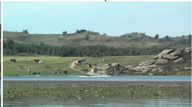
Фото 6. Колыванское озеро (снимки 2014 г.)