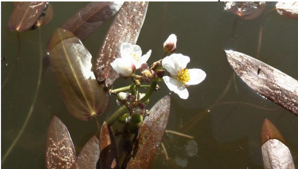
Фото 4. Чилим: цветение