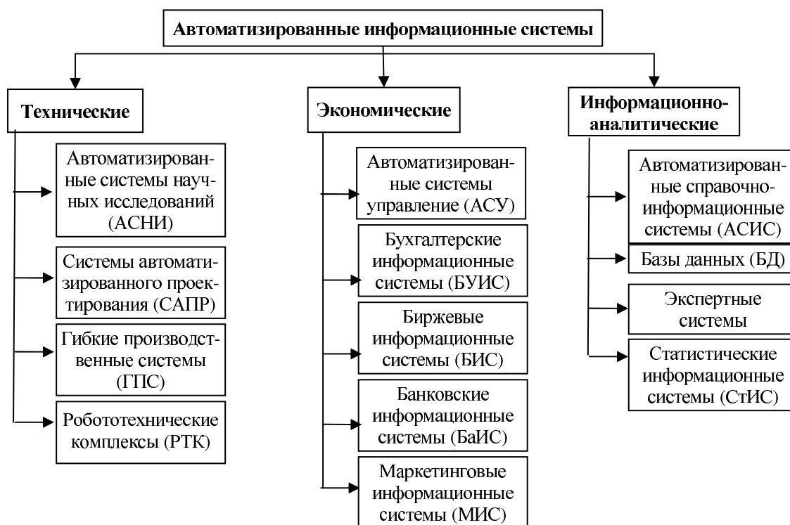
Рис. 2. Классификация информационных систем по предметной области

По принадлежности к конкретной предметной области можно подразделить информационные системы на три класса: технические, экономические, информационно-аналитические (рис. 2).