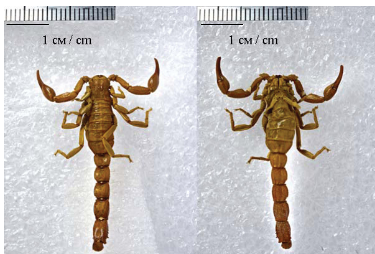
Рис. 1. Внешний вид скорпиона, обитающего на территории заповедника «Оренбургский»

В ходе работы был проведен морфологический анализ представителя скорпионофауны оренбургского заповедника, который показал, что общая длина взрослого самца 42 мм. Число пектиновых зубцов у собранного образца 25. Хелицеры желтые. Педипальпы и сегменты метасомы не имеют щетинок. Панцирь и тергиты желтовато-коричневые, пигментированные черным; метасома, тельсон, педипальпы и ноги светло-песочные. Подвижные пальцы педипальп с 11 режущими рядами зубчиков и пятью концевыми зубчиками. Центральные латеральные и задние латеральные кили панциря не соединяются, образуя непрерывный линейный ряд гранул к заднему краю. Седьмой стернит с 4 хорошо выраженными гладкими киями. Четвёртый метасомальный сегмент с латеромедиальным гладким килем. Тельсон вытянутый. Анальная доля разделена бороздой на две части (рис. 1).